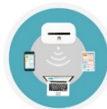
in your mobile Wifi hotspot

Pour les voyageurs qui ne possèdent pas d'ordinateur portable ni de tablette avec un port adapté à la lecture d'une carte SIM, Transatel offre également, comme alternative, une connexion en hotspot Wi-Fi. Commandé et livré déjà préconfiguré avec sa carte SIM, le hotspot partage simultanément son accès à Internet avec jusqu'à dix périphériques distincts. Il s'agit donc d'une solution idéale pour les voyages en famille, entre amis ou entre collègues. Elle permet en effet de consulter ses emails, naviguer sur le Web, utiliser les apps de navigation, regarder des vidéos en streaming, rester connecté aux réseaux sociaux et envoyer à tout moment photos et vidéos.