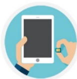
in your iPad or other tablets