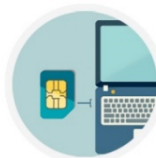
in your laptop